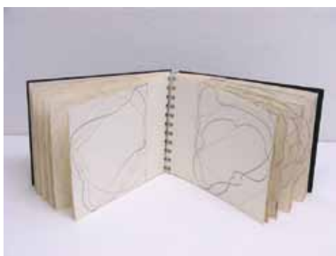
Malbuch 09-1 13.8×17.5×1.8cm 水彩 2009

Plandrawing・draft Qf-SHOH《掌》 90・Holz / 145 各19.5×19.5cm 紙 / 鉛筆 2009