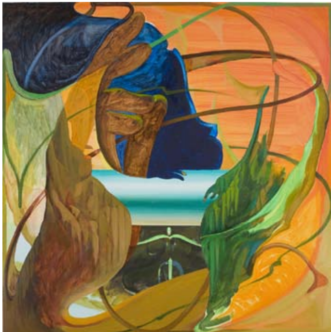
M399 Qf-SHOH 《掌》 90・Holz -2 90×90cm アクリル・油彩 / 板 2009