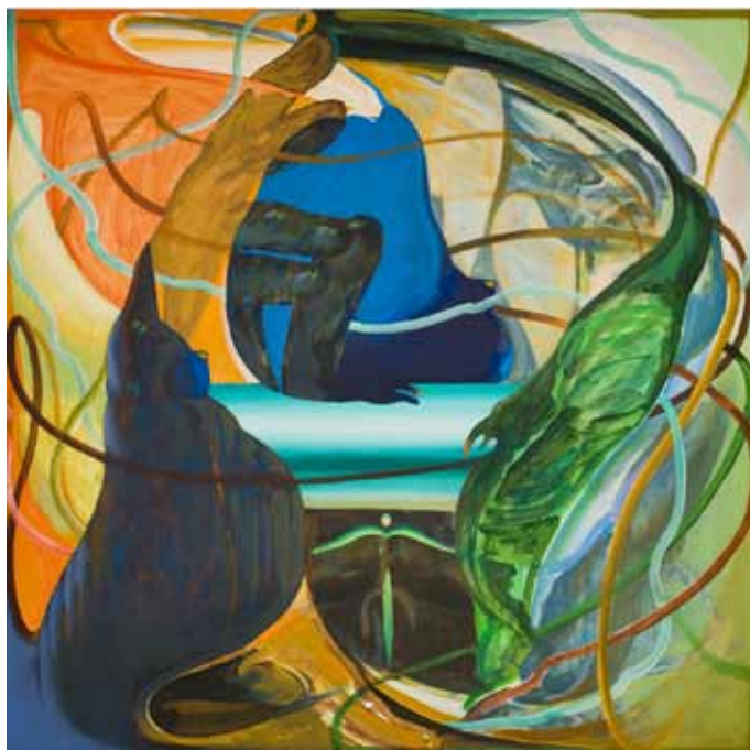
M400 Qf-SHOH 《掌》 90・Holz -3 90×90cm アクリル・油彩 / 板 2009