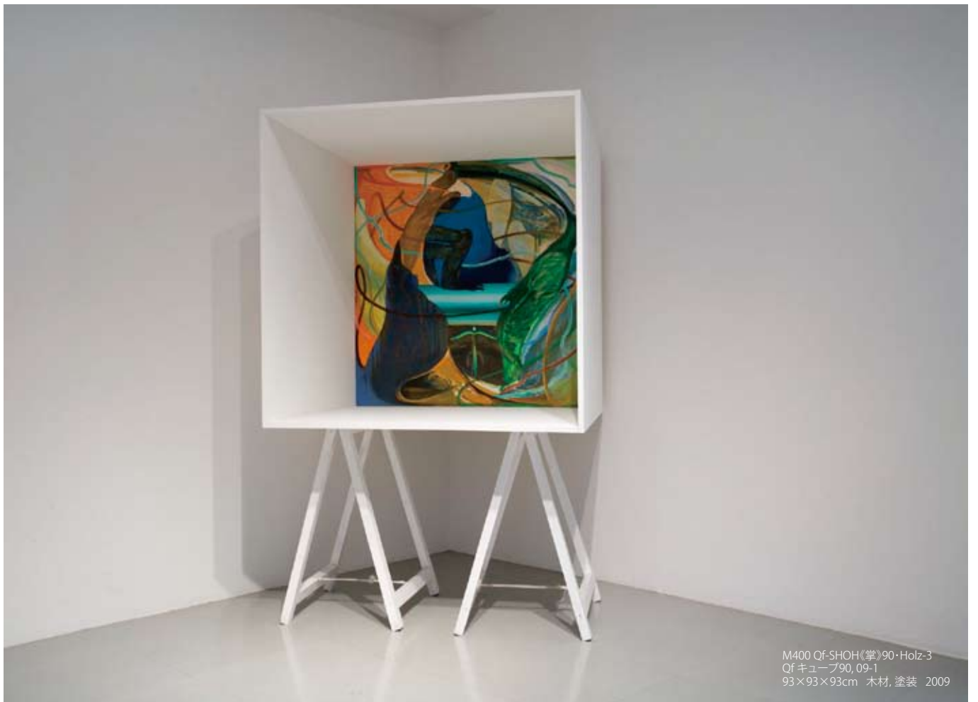
M400 Qf-SHOH《掌》90・Holz-3 Qf キューブ90, 09-1 93×93×93cm 木材, 塗装 2009