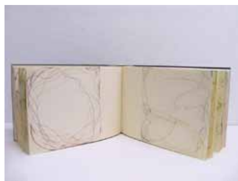
Malbuch 09-2 14.7×26×2.4cm 水彩 2009