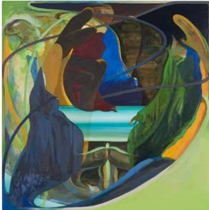
M398 Qf-SHOH 《掌》 90・Holz -1 90×90cm アクリル・油彩 / 板 2009